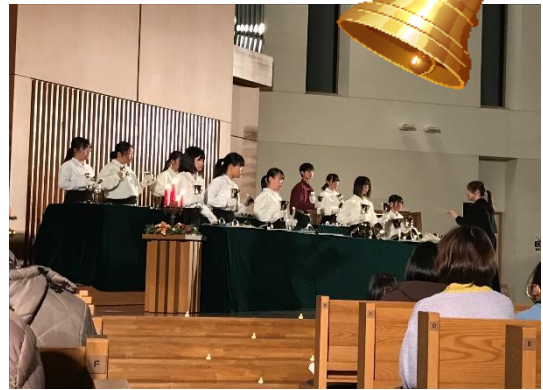
〔♪ホワイトクリスマス♪「チャペル」〕

神にはみ栄えあれ」を含め7曲を演奏し、来場者を魅了しました。また、24日(日)の午後には「クリスマス街頭コンサート」を山形駅自由通路「アピカ」で行いました。通行人の多くが足を止めて演奏を聴いてくれました。恒例のコンサートとして定着しました。