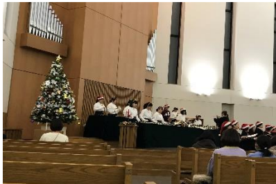
〔合唱団「Pianeta」とのコラボ〕

ハンドベル部が12月23日(土)に本校チャペルを会場に第19回クリスマスコンサート(17:00開演)を行いました。コロナ禍での制限が緩和されるのに合わせて、少しずつ来場者が戻ってきました。昨年より多い328名が来場しました。全14曲2ステージを部員12名で演奏しました。今年は合唱団「Pianeta」とコラボして演奏の合間に合唱を披露していただきました。